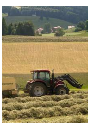
Ils font du foin, Dominique Garing