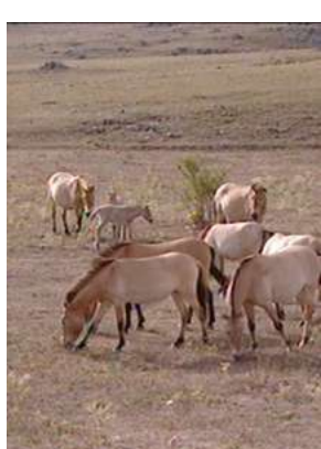
Przewalski, le dernier cheval sauvage, Laurent Charbonnier