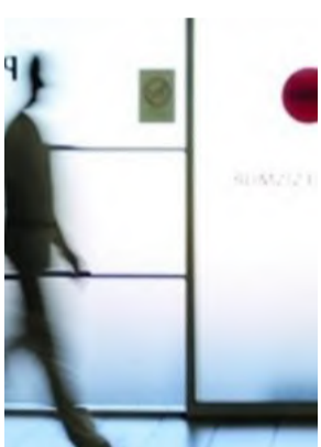
L'interne de garde, Virginie Saclier