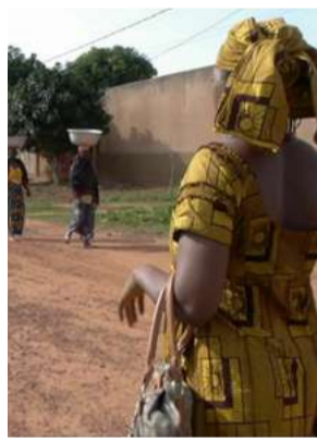
Tontines, une affaire de femmes, Simon Panay