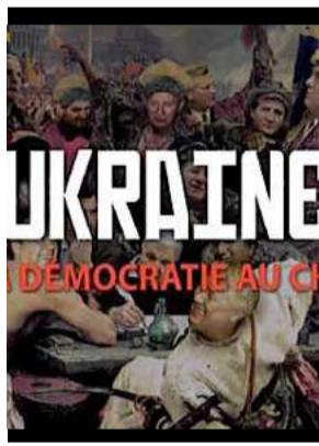
Ukraine, de la démocratie au chaos, Jill Emery, Jean-Michel Carré