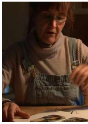
Chalap, une utopie cévenole, Antoine Page