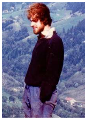
Être sans avoir, Christophe Ferrux